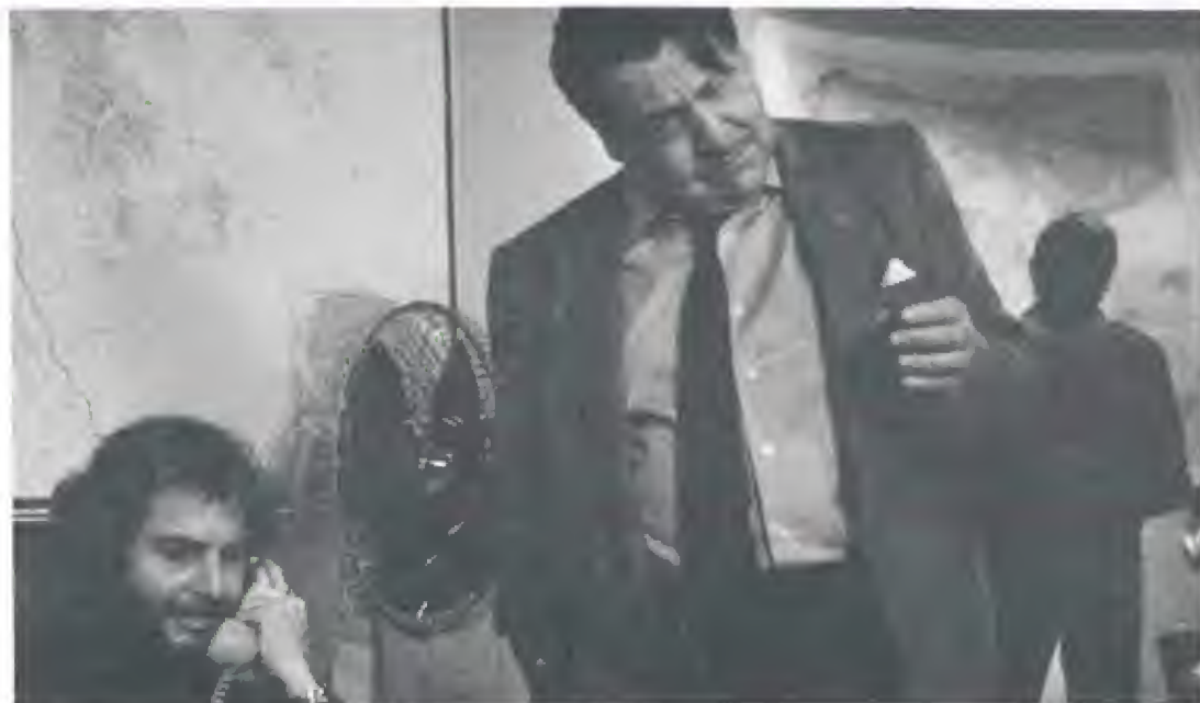
Hugo Stiglitz - Fernando Sancho